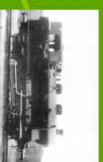
malá parní lokomotiva