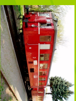
historický motorový vlak